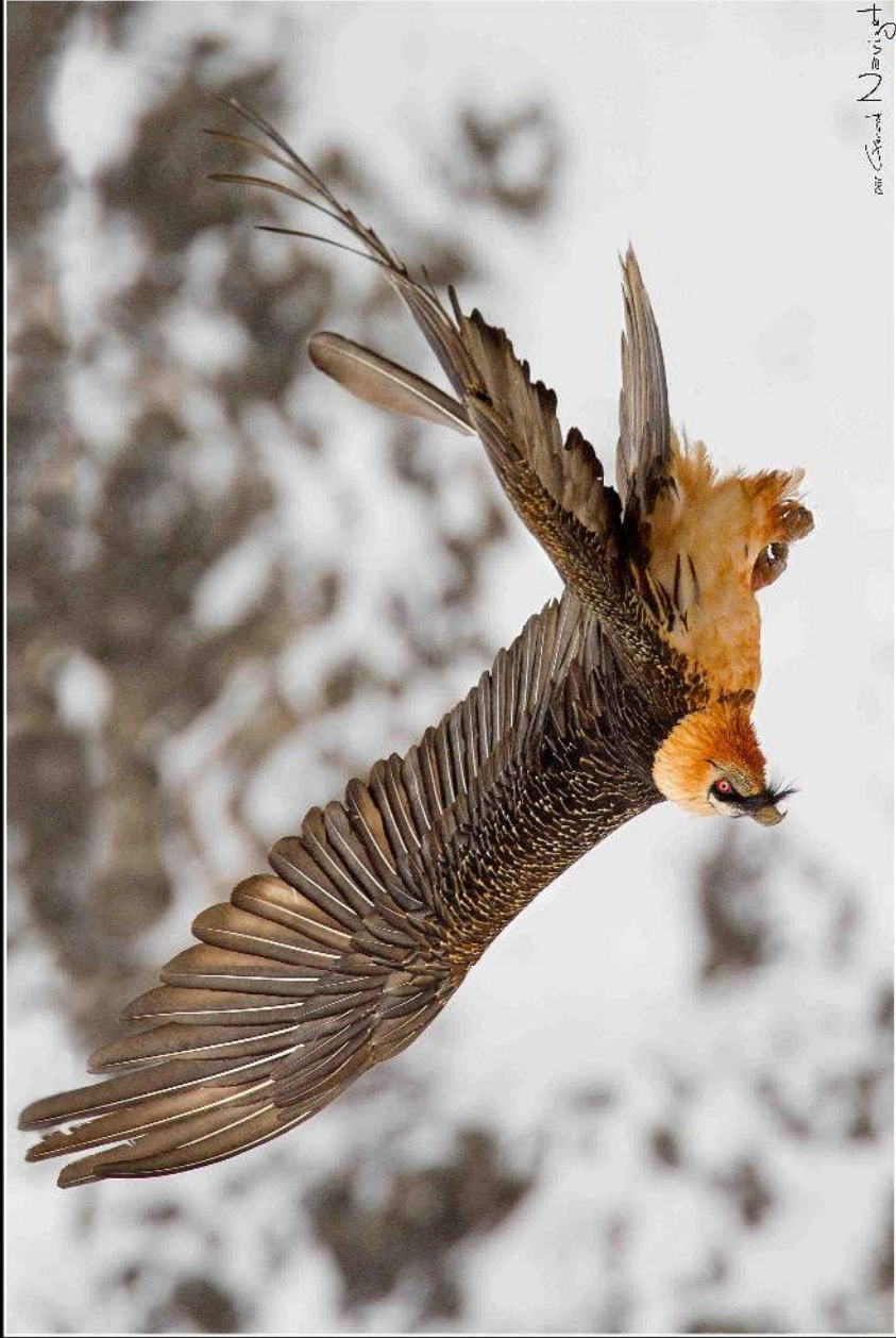
Le gypaète barbu ( Gypsetus barbatus )