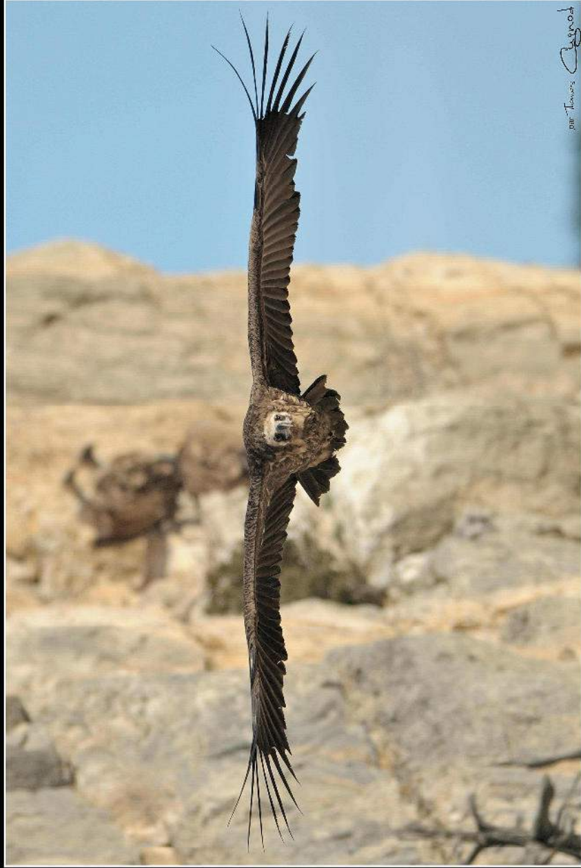
Le vautour moine ( Gypsetus monachus )