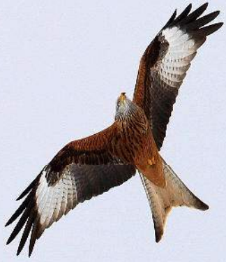
Le milan roya ( Buteo buteo )