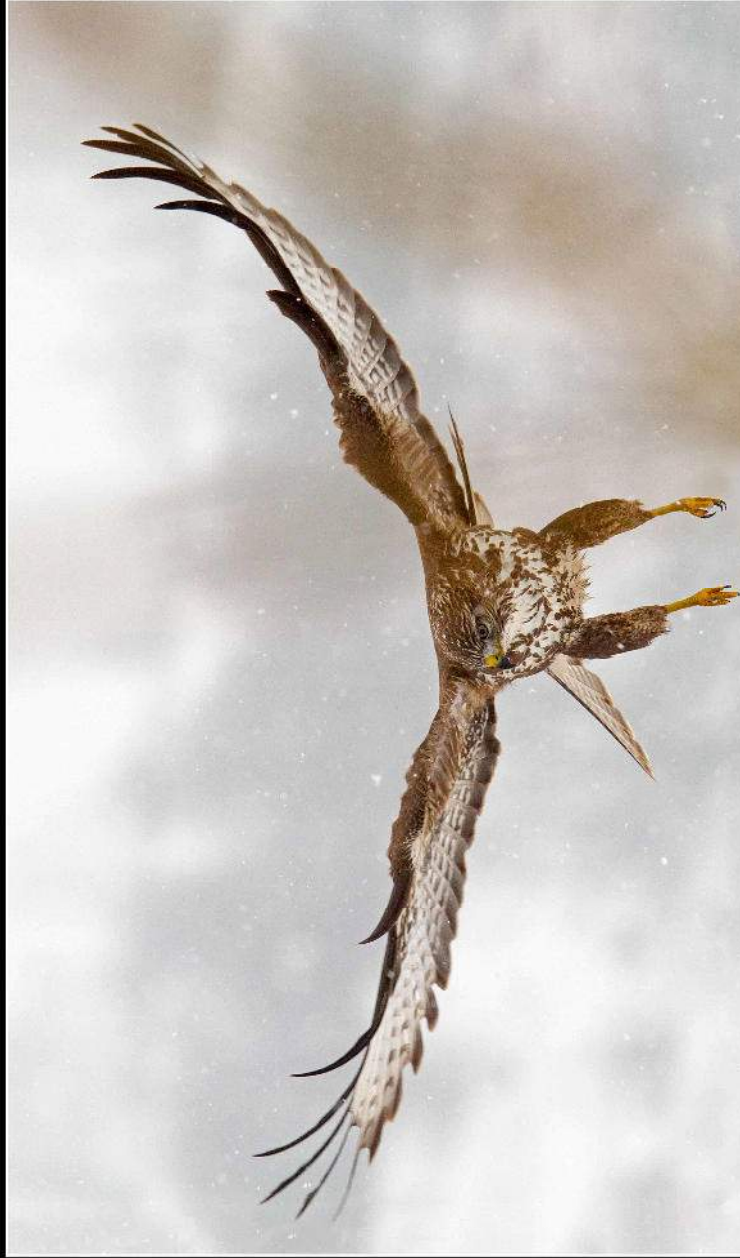
La buse variable ( Buteo buteo )