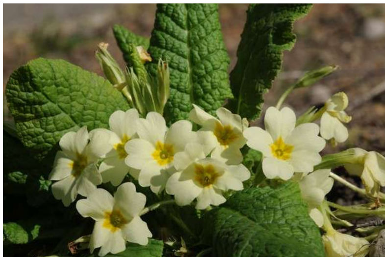
La primevère vulgaire, une plante sauvage aux nombreuses variétés horticoles.